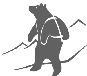
知床のトコちゃん