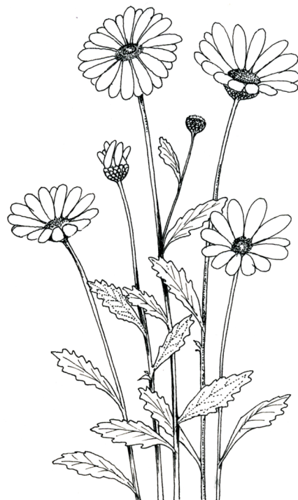
フランスギク・外来帰化植物です。道路脇や花畑に綺麗に咲いていますが、駆除対象の植物なんだそうです。すごい繁殖力。でも、きれい・・・